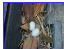
鳩の卵がある。又はヒナがいる