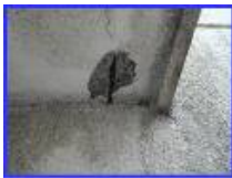
建物の劣化、コンクリートの剥離がある