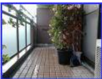
人工芝やタイルが敷いてある