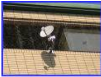
手摺外側にアンテナや障害物がある