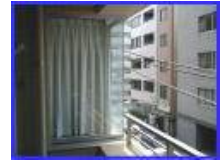
ガラス (工法上の障害)