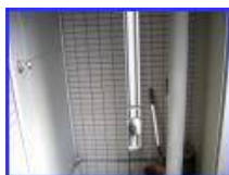
別の場所に独立した開口部がある