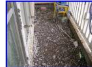
(全体に積もる程度) ※別途産廃料金が発生 (ゴミ袋4袋以上が目安)