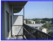
隔壁又は外開口 (開口部あり)