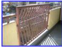
手摺などが外側に張り出している