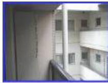
壁・構造体 (開口部なし)