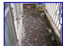
鳩糞が全体に数cm以上積もっている↓