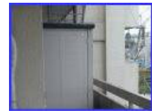
動かせない大きな物置などがある