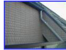
床の真上に天井が無い(上階が無い)