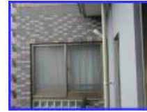
窓や扉 (施工面上の障害)