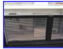
その他のタイプ (又は混合型)