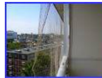
既存のネットがある(撤去依頼)