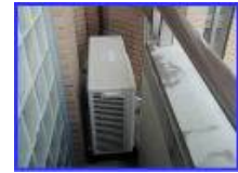
手を入れられない程非常に狭い