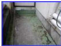
排水口がなく水が流せない